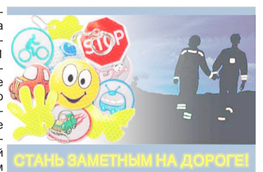
СТАНЬ ЗАМЕТНЫМ НА ДОРОГЕ!

Световозвращающие элементы необходимо прикреплять к верхней одежде, рюкзакам, сумкам так, чтобы при переходе через проезжую часть на них попадал