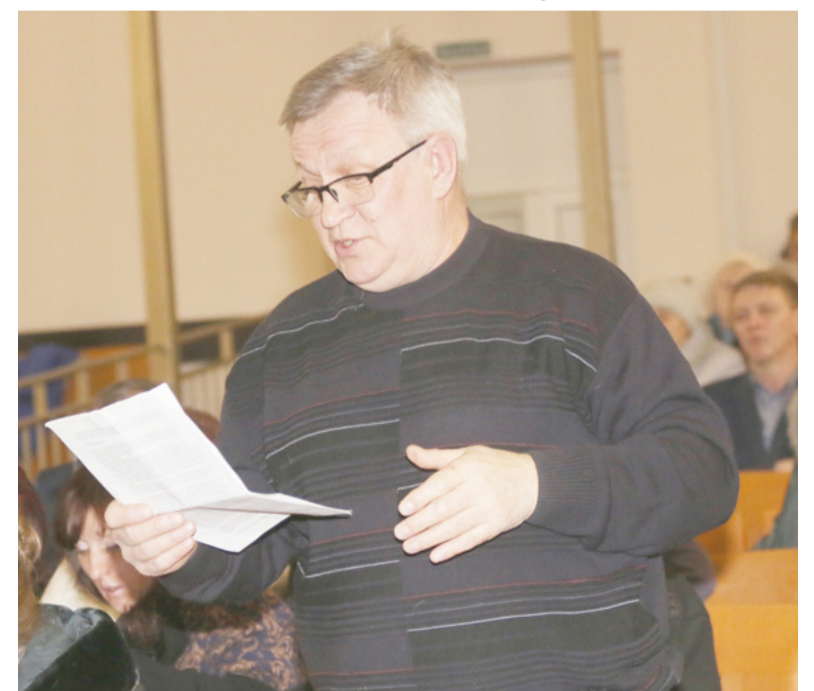
Выступает житель посёлка Никольский