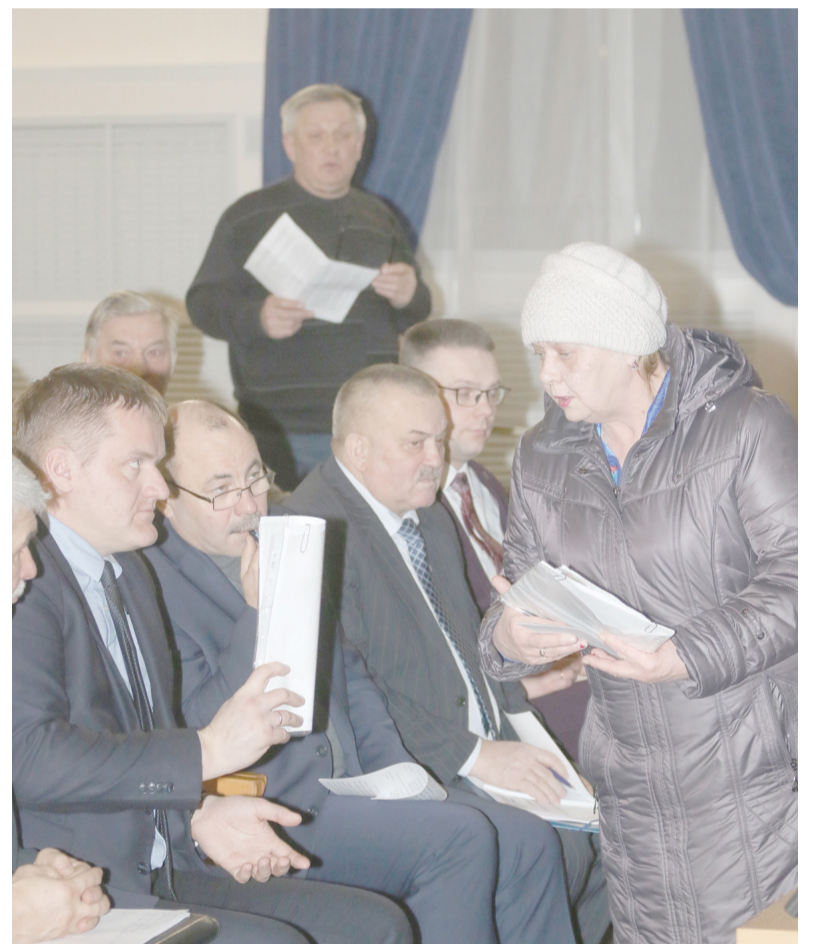
С вопросом к местной власти